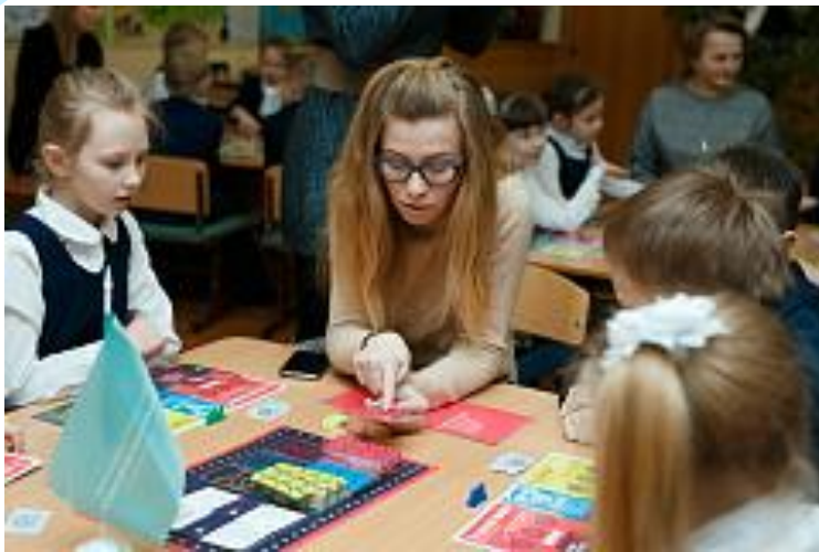
Игра «Не в деньгах счастье»