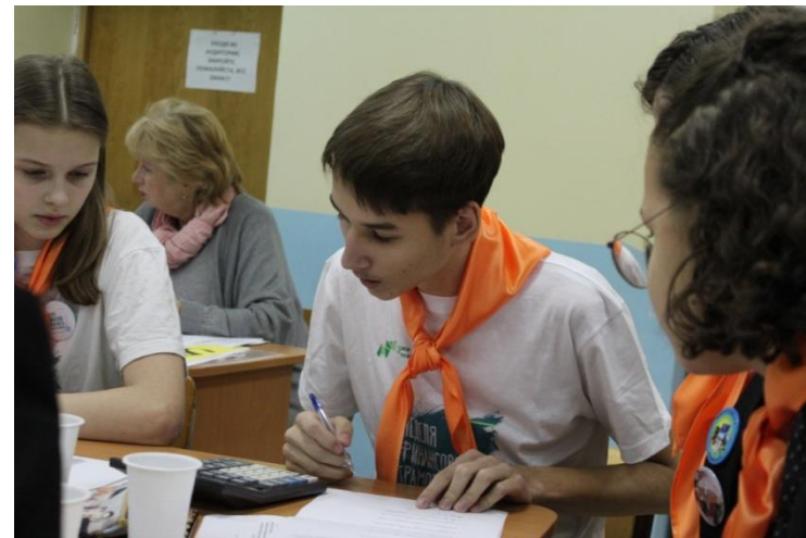
Чемпионат «Азбука финансовой грамотности»